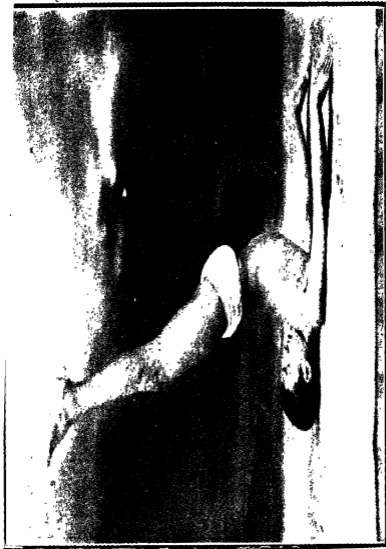
सर्वांगासन ( खुले हाथ )